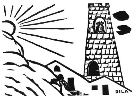
Figura 7: Dila de Caruaru. História do Cavaleiro Roldão (1982). Xilogravura, 25 x 18 cm.

A oficina, separada do ambiente terreno do lar pela íngreme escada que arquitetou, se abria como um portal para viajar à São Saruê, onde o “voo mágico” (RIBEIRO, 1987), promovido pelo delírio do verbo e imagem, o conduzia para um universo abundante de possibilidades. Sentado na mesinha próxima à janela, deslocava-se no tempo e no espaço, desembarcava no universo épico do cangaço ou do mundo medieval. Nesses transcurtos, a chaminé da Fábrica de Caroá emoldurada pela Janela de seu ateliê, se tornara a torre onde estava a princesa da História do Cavaleiro Roldão [figura VII] 35 .