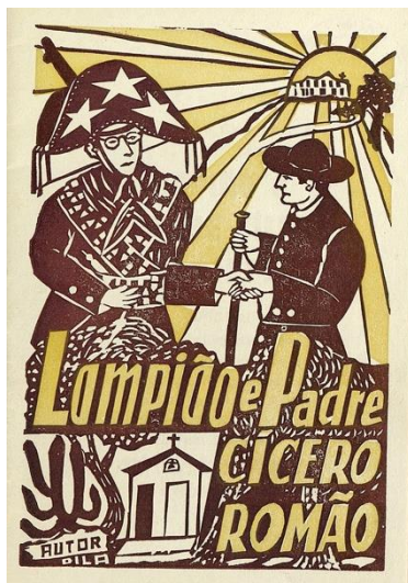
Figura 2: Capa do folheto Lampião e Padre Cícero (1978), ilustrada por Dila de Caruaru.

sobreviver naquele solo reputado como infrutífero 26 ; frequentadas por personagens representativos da fé cristã, do coronelismo e da resistência armada, confrontados ou comungados. Na capa do folheto Lampião e Padre Cícero (1978b), esse quadro ganha nitidez [figura II] 27 .