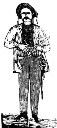
Figura 6: Gravura impressa na capa do folheto Antônio Silvino: O rei dos cangaceiros (1907).

Cotejando esta imagem idealizada pelo poeta-gravurista na década de 1970 com a primeira imagem xilográfica identificada em um folheto de cordel (1907) 32 , percebemos que o percurso de esquematização desenvolvido no âmbito literário, que fez do cangaceiro uma figura emblemática, se processou também no campo da gravura, sobretudo a da escola pernambucana 33 [figura VI] 34 .